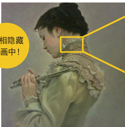
奥龙之介的作品 《抚弄》 TELE 450 mm